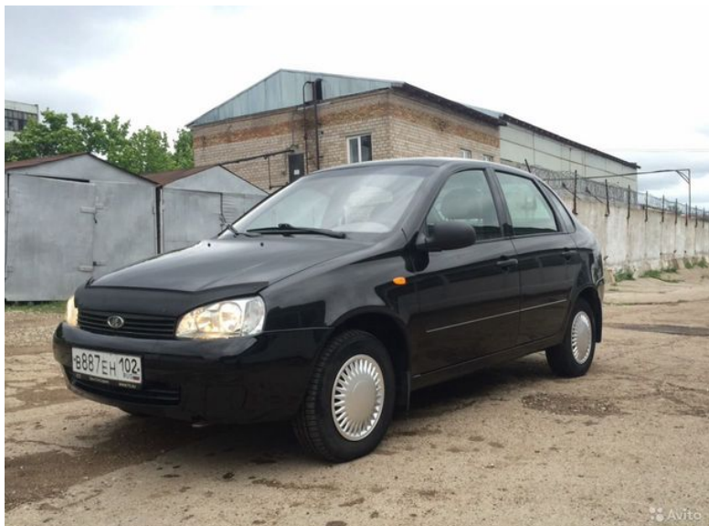
Фотография от 18 июня 2016 года